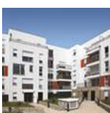
Persan (95) Résidence La Copette 92 logements locatifs sociaux Architecte : De Cussac